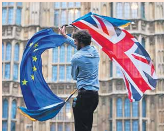
La campanya pel referèndum ha estat intensa al Regne Unit.

racisme i la xenofòbia. Seguidament, les conseqüències de la victòria d'aquestes idees: per ara, el nombre d'agressions de caire racista al Regne Unit s'ha multiplicat per cinc des de la victòria del Brexit i centenars d'immigrants són intimidats i atacats per individus envalentits i autojustificats per la retòrica xenòfoba que s'ha gastat en la campanya, començant per la (ja oblidada?) diputada laborista Jo Cox i seguint per treballadors de tot el món que, des de fa anys, contribueixen al creixement econòmic d'aquell país. Finalment, la crisi política a la UE, que segurament necessita repensar-se a fons,