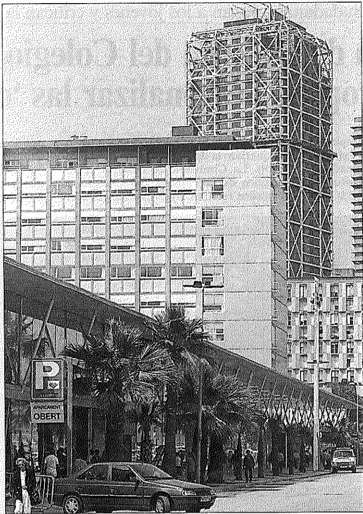
El hospital del Mar.