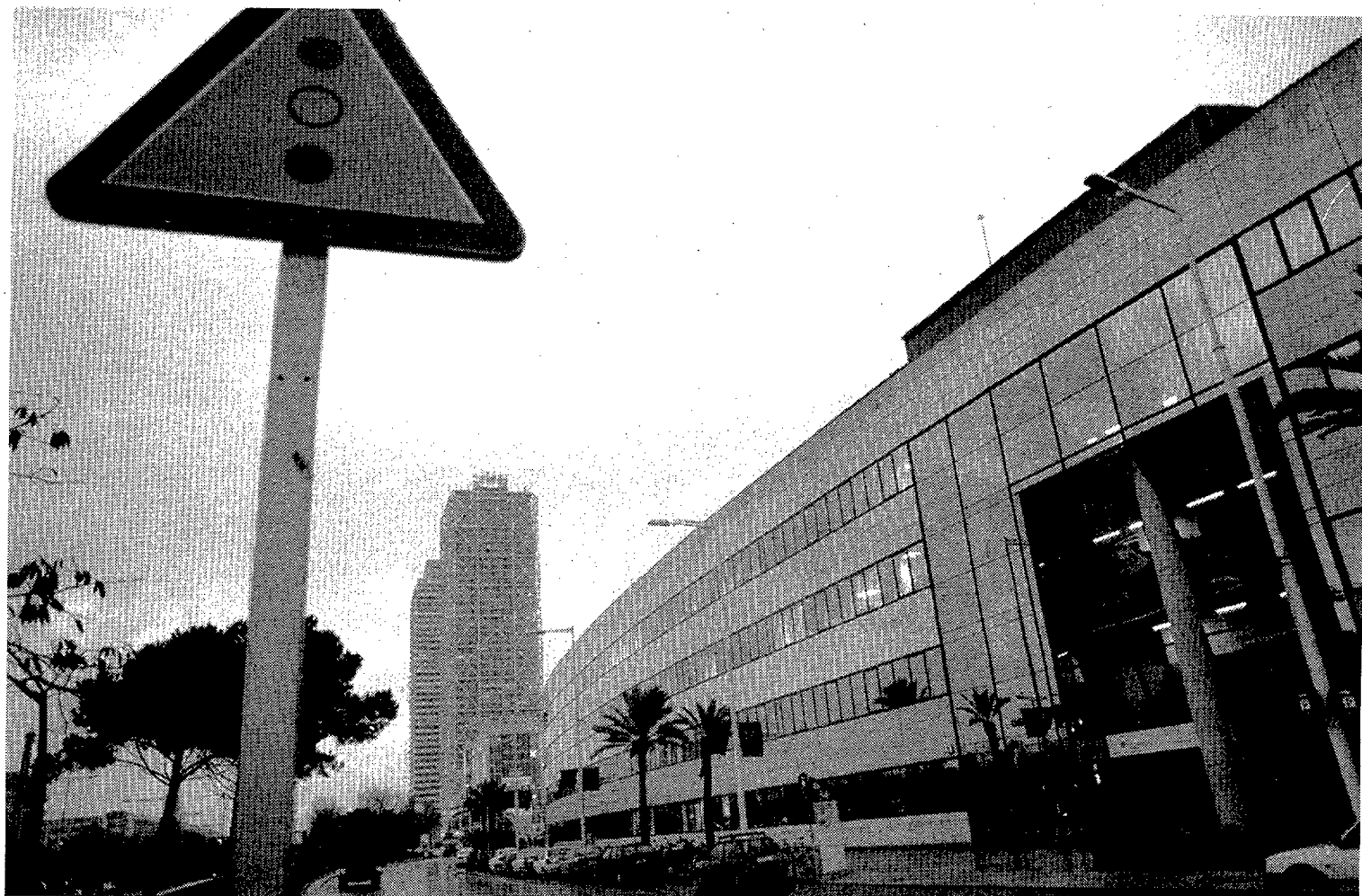
La que debía haber sido la sede de la Agencia Europea del Medicamento albergará a la UPF

La parte cedida, un lateral del edificio de tres plantas, nunca se ha utilizado desde que se acabó en 1992. Otro lateral sirvió como laboratorio anti-doping durante los Juegos Olímpicos y ahora depende del Institut Municipal d'Investigació Mèdica, que lo ha destinado a laboratorios y despachos. Y la planta baja y trasera, la que se une al hospital del Mar, está ocupada por la unidad docente de la Universitat Autònoma de Barcelona, que está previsto que se adscriba a la UPF.