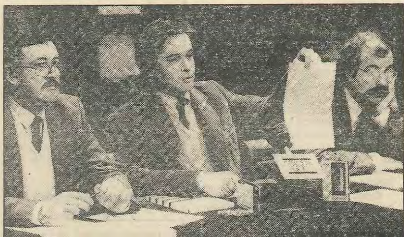
Los tres doctores municipales, mostrando la acreditación olímpica que autoriza a efectuar el control anti-doping en Barcelona

El presidente de la F. Internacional de Tiro visitó nuestra ciudad